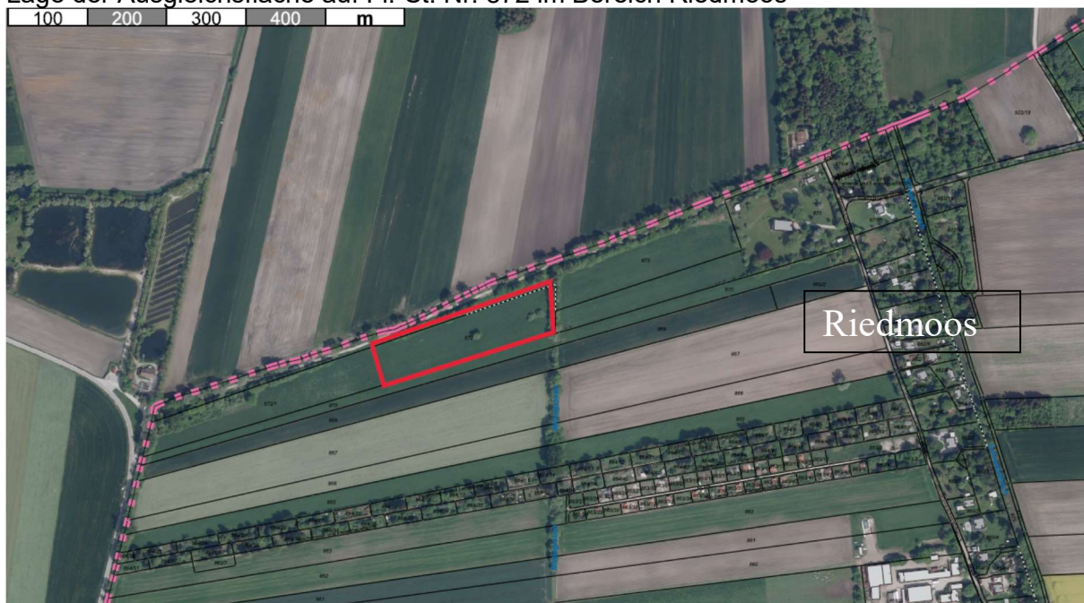
Lage der Ausgleichsfläche auf Fl.-St. Nr. 872 im Bereich Riedmoos

Unterschleißheim, 17.09.2018 12.11.2018 22.03.2021