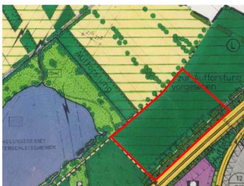
Rechtsverbindlicher Flächennutzungsplan in der Fassung vom 03.06.1991

Im Rahmen der Neuaufstellung des Flächennutzungsplanes hat die Stadt von dieser Zielsetzung Abstand genommen. Die Fläche wird als Landwirtschaftsfläche dargestellt. Im südlichen Randbereich, unmittelbar an der Autobahntrasse sind Potenzialstandorte für die Errichtung von Photovoltaikanlagen in den Plan aufgenommen. Diese sind aufgrund der Maßgaben der Vergütungsverordnung (110 m - Regelung) und ihrer vergleichsweise geringeren landschaftlichen Reiz, für die Errichtung solchen Anlagen prädestiniert.